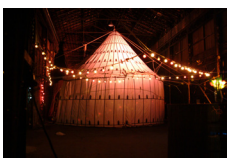
Théâtre forain - Cie Attention Fragile