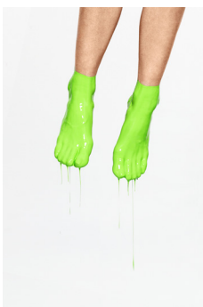
Évènement - Théâtre forain sous les platanes