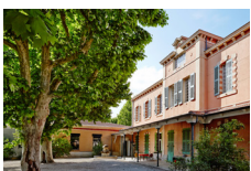
Cour du 3 bis f - lieu d'arts contemporains